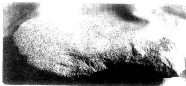
景区内三大车坝、马寨山、 新桥等处出土的早期新石器。